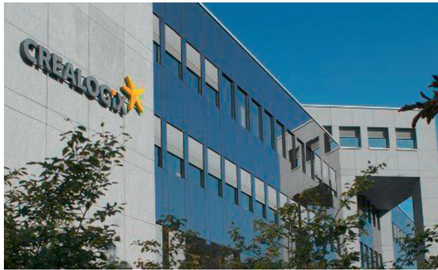
CREALOGIX Firmengebäude in Zürich

CREALOGIX ist ein börsennotiertes, weltweit führendes Softwareunternehmen aus der Schweiz, das digitale Finanztechnologie-Lösungen für Banken und Wealth-Management-Unternehmen entwickelt. Mit seinem Digital Hub stellt CREALOGIX eine standardisierte modulare Engagement-Plattform zur Verfügung und bietet Lösungen zur personalisierten Kundeninteraktion über digitale Kanäle - vom Chat bis zum virtuellen Assistenten.